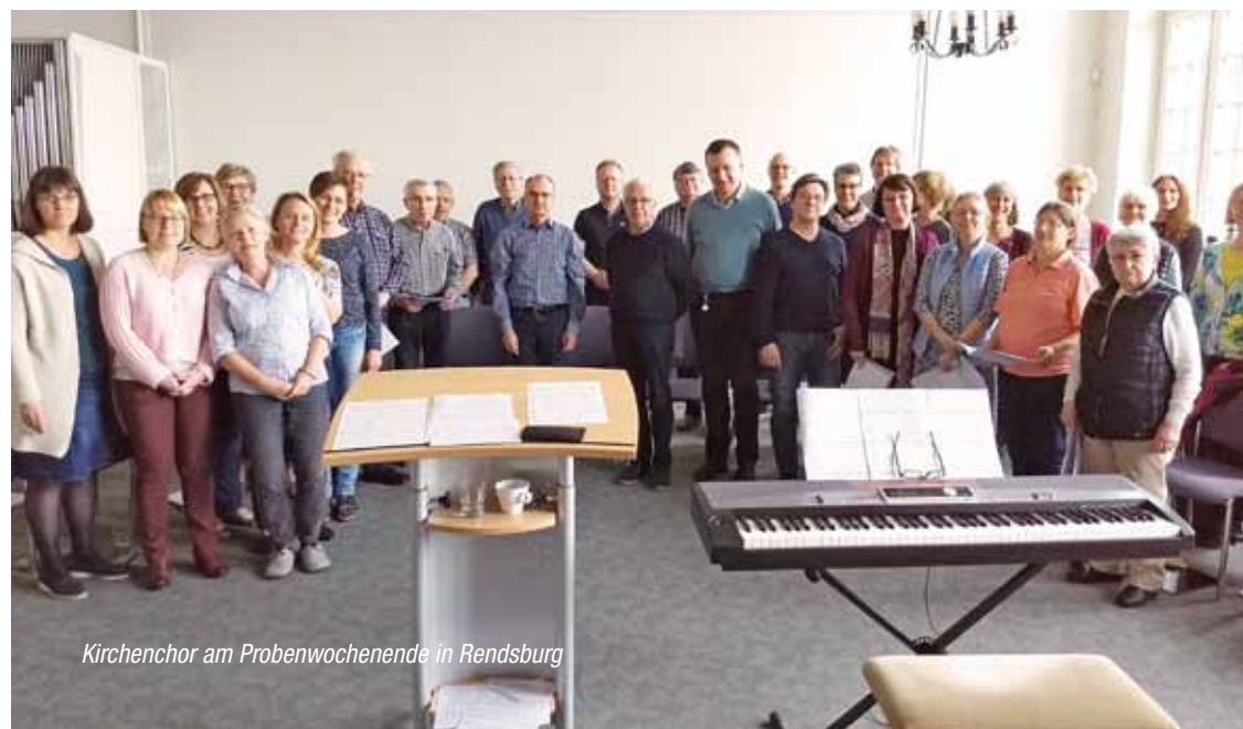
Kirchenchor am Probenwochenende in Rendsburg

nur das erste Patrozinium unserer neuen Pfarrei Heiliger Martin, sondern im Hochamt um 11.15 Uhr singt der